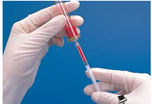
150 \mu Lの全血検体を検体滴下用シリンジにとります。(シリンジの線まで全血検体をとると150 \mu Lになります)