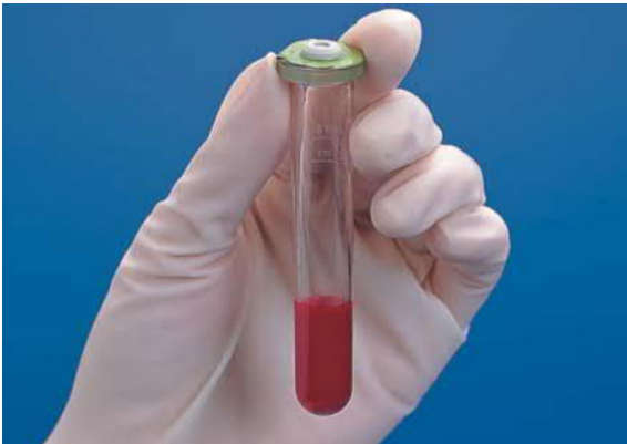
EDTA全血あるいはヘパリン全血