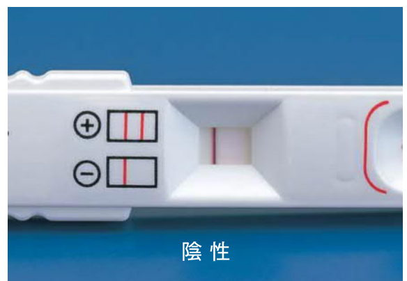
コントロールラインのみが発色した場合は、陰性 \ominus と判定します。

シグナルラインがわずかでも発色した場合は陽性 \oplus と判定してください。