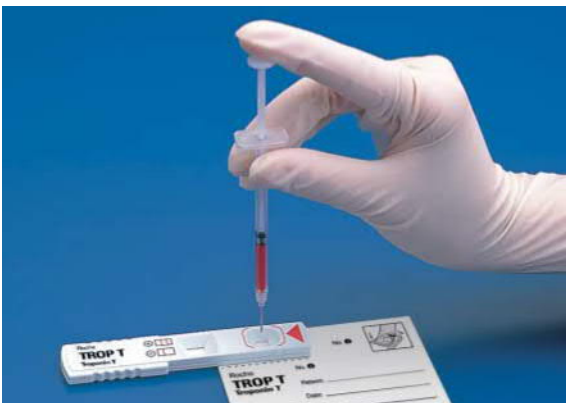
検体滴下用シリンジの全血検体150 \mu Lを、試験紙の検体滴下孔に滴下します。検体滴下後15分間静置してください。